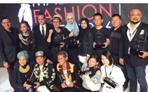
日前，在吉隆坡举行的2016马来西亚国际时装周上，漯河职业技术学院轻工系服装专业太思米亚教学团队研发的服饰产品荣获本届时装周的最高奖项——2016年亚洲最具影响力设计奖。本届时装周吸引了来自马来西亚、中国、日本、韩国、澳大利亚、印度、印尼、新加坡、土耳其等16个国家和地区的300多家国际服装展商参与。此次由漯河职业技术学院服装专业太思米亚教学团队设计研发的服饰产品以其简约、大气、清新的中国风席卷全场，在众多参赛作品中脱颖而出。(张建华 崔迎朝)