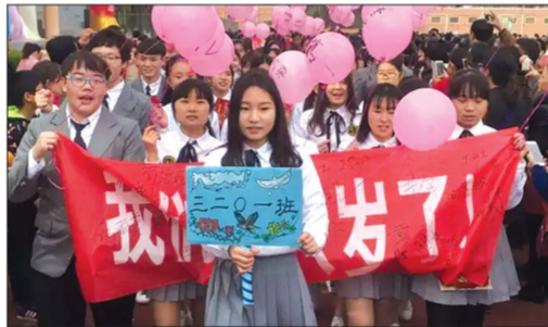
11月19日，灵宝一高隆重举行以“成长 感恩 责任”为主题的2017届毕业生18岁成人仪式，经过“升国旗奏国歌、校长寄语、发放成人卡、心愿墙上写梦想、感恩的心、学生宣誓、迈过成人门、点燃18岁生日蜡烛”等环节，2000多名高三学生迈入成人的行列，开启了新的人生起点。(魏宏亮)